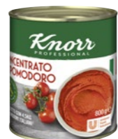
Paradajkový pretlak 0,8 kg