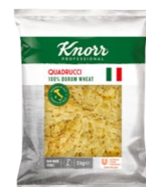
Quadrucci - fliacky 3 kg

Priamo zo slnečného Talianska pre vás dovážame kvalitné semolinové cestoviny, ktoré neobsahujú pridané vajce. Vyberte si zo širokej ponuky tvarov a veľkostí na každú príležitosť.