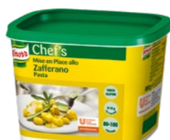
Šafránová pasta 800 g