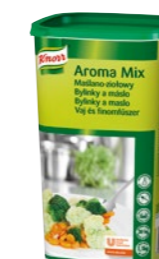
AromaMix Bylinky & Maslo 1,1 kg

Keď potrebujete ochutiť cestovinové, ryžové či zeleninové jedlá a dodať im niečo navyše. Jedlá potom počas uchovávaní v ohrevných nádobách nestratia svoju vlhkosť, chuť ani vôňu.