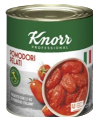
Pelati – Paradajky celé lúpané 2,5 kg