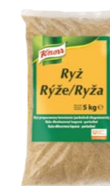
Ryža dlhohrzná parboiled 5 kg Počet porcií: 71

S dlhohrznou ryžou parboiled dosiahnete vždy rovnako dobrú a sypkú konzistenciu. Klasická príloha k mäsám aj ako základ ďalších ryžových variácií.