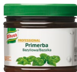
PRIMERBA Bazalka 340 g

Veľmi kvalitné pasty z voňavých bylín a zeleniny, ktoré boli šetrne spracované ihneď po zbere, bez konzervantov a pridaných farbív. Ideálne na prípravu studených aj teplých jedál.