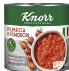
Polparicca – Krájané paradajky 2,55 kg