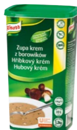
Hubový krém 1,3 kg Počet porcií: 47

Z ponuky našich trendy zahustených polievok si určite vyberie každý, kto chce svojim zákazníkom na tanieri servírovať vždy iba to najlepšie.