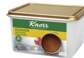
Goldaugen - Hovädzi bujón 3 kg

Goldaugen – známa receptúra „so zlatými očkami“ – je zárukou bujónu so silnou vôňou a chuťou vývaru z hovädzieho mäsa. Ideálny na zosilnenie hovädzej chuti polievok, omáčok, štiav či jedál s hovädzím mäsom.