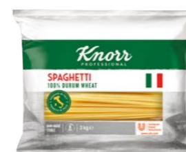
Spaghetti 3 kg