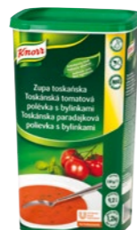
Toskánska paradajková polievka s bylinkami 1,2 kg Počet porcií: 37