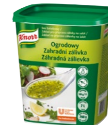
Záhradná zálievka 700 g Výdatnosť: 7 l

Spestrite svoju ponuku šalátov so zálievkou Knorr. Vďaka stabilnej konzistencii sa jednotlivé zložky neoddeľujú ani po niekoľkých hodinách, zálievka je tak vhodná aj na prípravu šalátových bufetov.