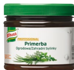
PRIMERBA Záhradné bylinky 340 g