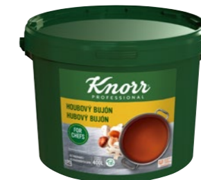
Hubový bujón 8 kg Počet porcií: 1 600