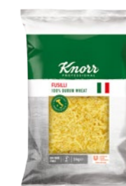
Fusilli 3 kg