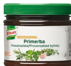
PRIMERBA Provencalské bylinky 340 g