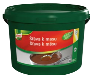
Šťava k mäsu 3,5 kg Výdatnosť: 35 l

Je použiteľná bez vlastnej úpravy alebo ako základ najrôznejších variácií štiav a oceníte ju hlavne pri príprave mäsa v konvektomate. Knorr šťava skrátka má šťavu!