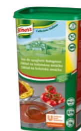
Základ na bolonskú omáčku 1 kg Výdatnosť: 8,5 kg

S prémiovými talianskymi omáčkami Knorr vyčarujete za okamih to pravé Taliansko. Perfektné k všetkým druhom cestovín, na gnocchi, tortellini aj ravioly, k hydinovému, teľaciemu a všetkým mletým mäsám.