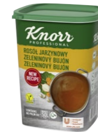
Zeleninový bujón 1 kg Počet porcií: 200

Všestranne využiteľné bujóny s plnou a bohatou chuťou zeleniny aj jemného korenia, napr. kurkumy a bieleho korenia. Bujóny sú bez alergénov – bez lepku a laktózy, bez palmového oleja. Vhodné pre vegánov.