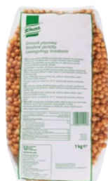
Smažené perličky 1 kg Počet porcií: 65

Vynikajúcu chuť a na tanieri vyzerajú veľmi lákavo. Závarky do polievok Knorr sú skrátka pohotovú doplnok, ktorý je vhodný nielen do vašich čírych a krémových polievok.