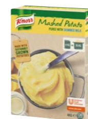
Zemiaková kaša s mliekom 4 kg Počet porcií: 130

Jemná zemiaková chuť a perfektná konzistencia, ako by ste prílohu pripravovali od základu. Ponúknite hosťom výbornú zemiakovú kašu.