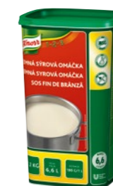
Jemná syrová omáčka 1,2 kg Výdatnosť: 6,6 l