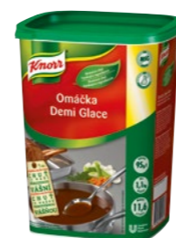
Demi Glace 1,1 kg Výdatnosť: 11,6 l

Minútkové omáčky Knorr sú skvelým riešením pre vaše menu: vždy rovnako kvalitné, so správnou konzistenciou a perfektnou chuťou aj vôňou. Pre všetkých moderných a kreatívnych kuchárov.