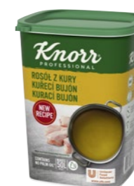
Kurací bujón 1 kg

Číre zlatisté bujóny s typickou chuťou a vôňou kuracieho vývaru. Vhodné do polievok, omáčok, štiav, marinád, na ochutenie zeleninových a hydinových jedál. Bujóny sú bez alergénov – bez lepku a laktózy, bez palmového oleja.