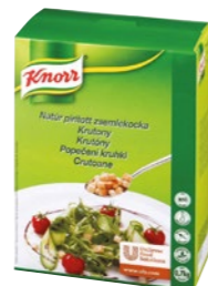
Polievkové krutóny 700 g Počet porcií: 85