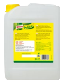
Delikat tekutý 5 l