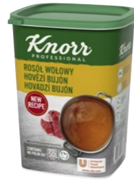
Hovädzí bujón 1 kg Počet porcií: 200

Číre bujóny so silnou chuťou a vôňou vývaru z hovädzieho mäsa sú vhodné na posilnenie hovädzej chuti v celom rade jedál: od polievok, omáčok, štiav a mariád až napríklad po kôprovú omáčku. Bujóny sú bez alergénov - bez lepku a laktózy, bez palmového oleja.