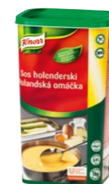
Holandská omáčka 1 kg Výdatnosť: 5,9 l