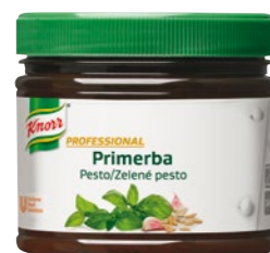
PRIMERBA Zelené pesto 340 g