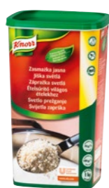
Svetlá zápražka 1 kg

Vďaka svojej granulovej konzistencii sa okamžite rozpúšťajú a netvoria sa hrudky, takže nimi môžete jedlo zahustiť kedykoľvek počas varenia. Skrátka rýchly a spoľahlivý pomocník pre všetky prípady.