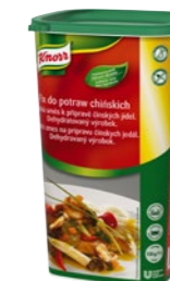
Fix do čínskych jedál 1 kg