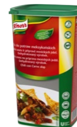
Fix do mexických jedál 1,2 kg

Ako jednoducho dosiahnuť vynikajúcu chuť, či už sa pustíte do klasiky alebo medzinárodnej kuchyne? Uľahčite si prácu s kvalitnými základmi Knorr. Sú vhodné aj na zapekanie.