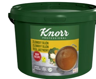
Zeleninový bujón 5 kg Počet porcií: 1 000