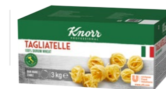
Tagliatelle 3 kg