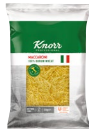
Polievkové rezance 3 kg Počet porcií: 50