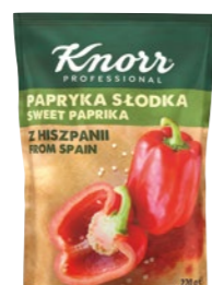
Sladká paprika zo Španielska 220 g

Skvelú chuť, jedinečnú vôňu aj plnú farbu jedla vždy podčiarkne kvalitné korenie. Vyberte si z našej ponuky. Sú vhodné pre studenú aj teplú kuchyňu.