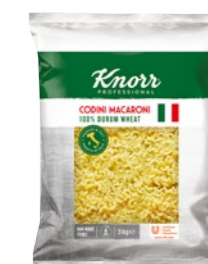
Codini - kolenka 3 kg