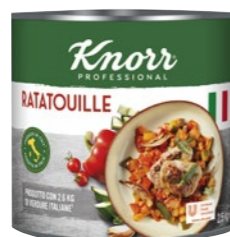
Ratatouille 2,5 kg