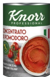
Paradajkový pretlak 4,5 kg

Špičková kvalita dostupná počas celého roku, to sú zeleninové zmesi z veľmi kvalitnej zeleniny privezenej priamo z Talianska. Špeciálne ochutené zmesi Knorr spĺňajú tie najvyššie nároky.