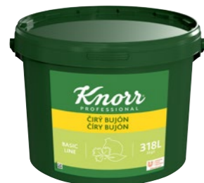
Číry bujón 7 kg Počet porcií: 1 272

Skvelý univerzálny bujón obohatený posekanou petržlenovou vňaťou a ďalšími bylinkami. Vhodný do krémových polievok, omáčok, štiav a ďalších jedál alebo na ochutenie vody na varenie vložiek a závariek.