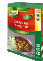
Základ na Kung Pao 1,5 kg