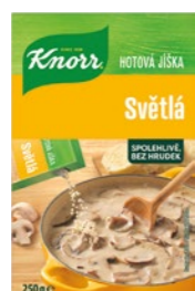
Zápražka svetlá 0,25 kg