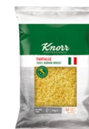
Farfalle 3 kg