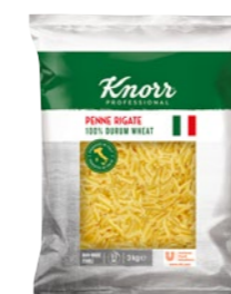
Penne 3 kg