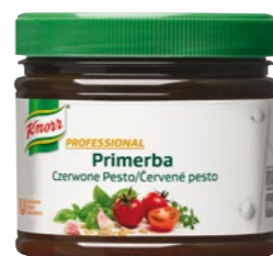
PRIMERBA Červené pesto 340 g