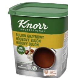
Hubový bujón 1 kg Počet porcií: 200

Tmavý hubový bujón s chuťou a vôňou hřibov a šampiňónov je skvelý na zosilnenie chuti v hubových polievkach alebo omáčkach, priam vynikajúci je na dochutenie hubového rizota.