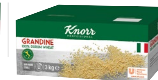
Grandine - Tarhoňa 3 kg