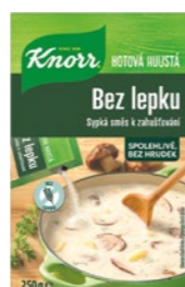
Huustá zátrepka bez lepku 0,25 kg