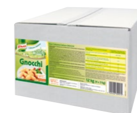
Gnocchi 12 kg