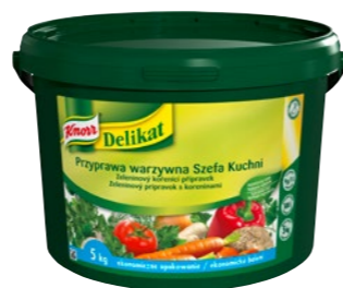
Delikat 5 kg