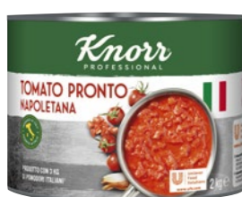
Tomato Pronto 2 kg