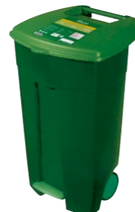
Číry bujón 60 kg Počet porcií: 10 908