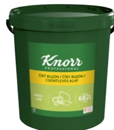
Číry bujón 15 kg Počet porcií: 2 728