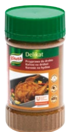
Delikat korenie na hydinu 600 g

Koreniace prípravky Knorr sú vhodné do teplej, ale aj studenej kuchyne. Originálne kombinujú chuť a vôňu vybraných bylín, zeleniny a korenia.