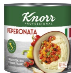
Peperonata 2,6 kg