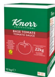
Paradajková omáčka 10 kg

Vyrobená v Taliansku z 22 kg paradajok, ktoré zreli na slnku. Paradajky sú udržateľne pestované. Obsahuje iba paradajky a morskú soľ. Vhodná pre vegánov.