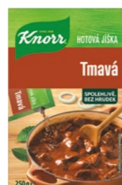
Zápražka tmavá 0,25 kg