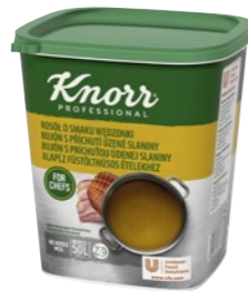
Bravčový bujón s príchutou údenej slaniny 1 kg Počet porcií: 200

Naozaj silný bujón s chuťou a vôňou po údenom mäse, s cibuľou a cesnakom. Perfektný na zosilnenie chuti údených mias alebo na dochutenie zemiakovej kaše.