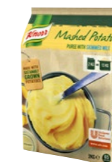
Zemiaková kaša s mliekom 4x 2 kg Počet porcií: 262