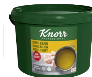
Kurací bujón 5 kg