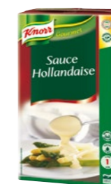
Holandská omáčka tekutá 1 l Výdatnosť: 1 l