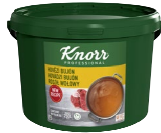
Hovädzí bujón 5 kg Počet porcií: 1 000