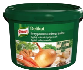
Delikat bez soli 3 kg