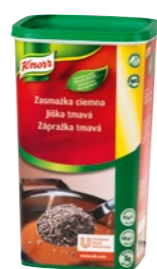
Tmavá zápražka 1 kg